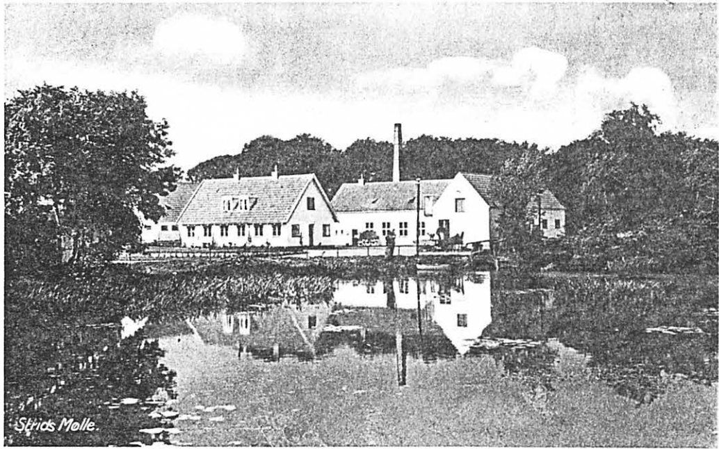
Kæppi postpost, udateret