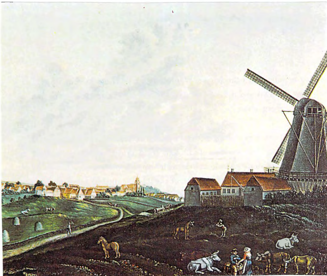
Havrebjerg Vindmølle. Guache fra tiden o. 1860-70